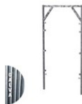
CADRE OUVERT GALVA V17 2 X 1M C V17 2X1G