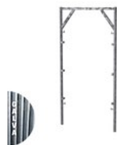
CADRE OUVERT GALVA V17 2 X 1M C V17 2X1G