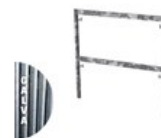
CADRE FERMÉ GALVA V18 1 X 1M C V18 1X1G