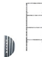
CADRE FERMÉ GALVA V18-7 2 X 0.7M C V18 2X07LE G