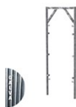
CADRE OUVERT GALVA V17-7 2 X 0.7M C V17 2X07LE G