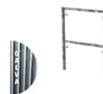
CADRE FERMÉ GALVA V18-7 1 X 0.7M C V18 1X07LE G