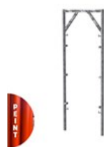
CADRE OUVERT PEINT V17-7 2 X 0.7M C V17 2X07LE