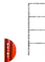
CADRE FERMÉ PEINT V18-7 2 X 0.7M C V18 2X07LE