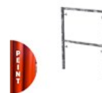
CADRE FERMÉ PEINT V18-7 1 X 0.7M C V18 1X07LE