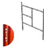
CADRE PEINT MANCHONNÉ V22-2 1.5 X 1.2M C V22 1.2