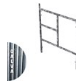
CADRE GALVA MANCHONNÉ V22-2 1.5 X 1.2M C V22 1.2 GAL