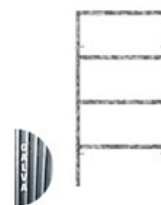
CADRE FERMÉ GALVA V18 2 X 1M C V18 2X1G