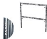
CADRE FERMÉ GALVA V18 1 X 1M C V18 1X1G