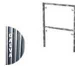
CADRE FERMÉ GALVA V18-7 1 X 0.7M C V18 1X07LE G