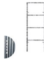
CADRE FERMÉ GALVA V18-7 2 X 0.7M C V18 2X07LE G