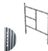
CADRE GALVA MANCHONNÉ V22-2 1.5 X 1.2M C V22 1.2 GAL