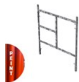
CADRE PEINT MANCHONNÉ V22-2 1.5 X 1.2M C V22 1.2