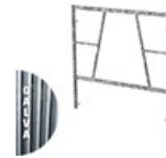
CADRE GALVA V25 1.5 X 1.5M C V25 1.5X1.5G